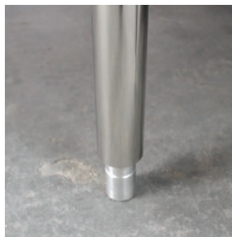
Montada sobre patas de tubo en acero inoxidable con niveladores en aluminio.