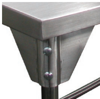
Esquinas reforzadas para trabajo pesado.