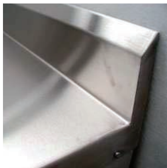
Tapa y salpicadero a la pared en una sola pieza.