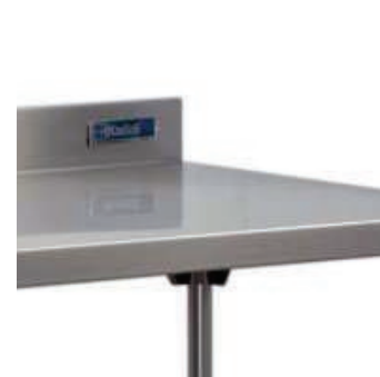
Superficie de trabajo en acero inoxidable fácil de limpiar.