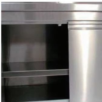
Entrepaño en acero inoxidable.