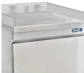
Opción múltiples salpicaderos.