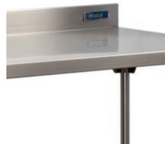
Superficie de trabajo en acero inoxidable fácil de limpiar.