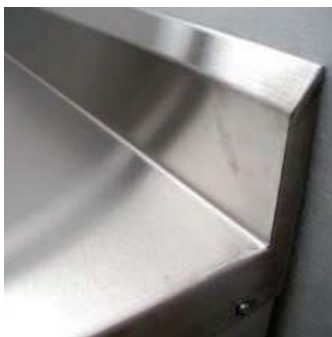
Tapa y salpicadero a la pared en una sola pieza.